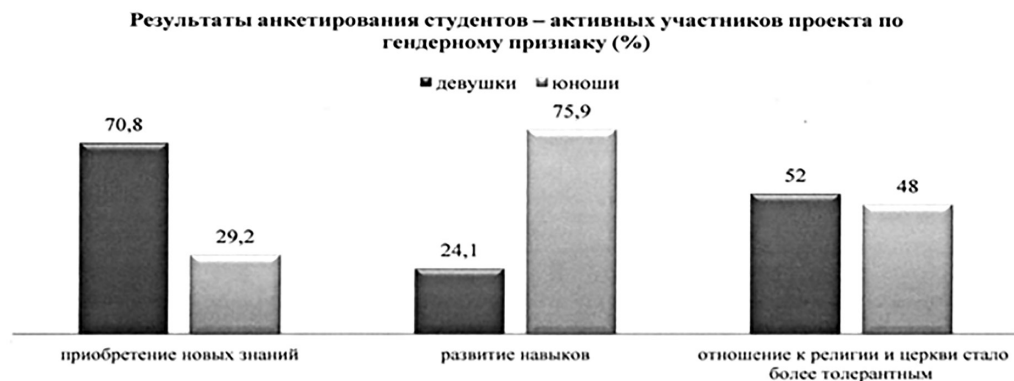
Рис. 2. Результаты анкетирования студентов – активных участников проекта «Дорога к храму: возрождение традиций православного питания» (по гендерному признаку)

При этом среди тех, кто сделал акцент на приобретении новых знаний, было больше девушек – 70,8% (34 чел. из 48). Среди тех, кто сделал акцент на получении новых практически-прикладных и профессиональных навыков, было больше юношей – 75,9% (60 чел. из 79) (см. рис.2).